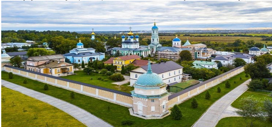
КАЛУГА - ОТ РЕЛИГИИ К НАУКЕ